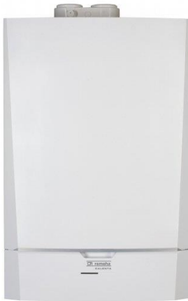
1. ábra "C" típusú gázkészülék

esetlegesen megoldhatják a problémát, azonban a megfelelő működés érdekében erre a célra kifejlesztett légbevezető nyílásokat javasolt beépíteni. Hatványozottan igaz ez a modernebb vagy felújított, fokozott légzárású nyílászárókkal ellátott épületekre, ahol ezek hiányában a CO feldúsulása csak idő kérdése. Jelentősen felgyorsítja a folyamatot, ha a gázkészülékkel egy légtérben valamilyen elszívó berendezést, vagy kandallót, cserépkályhát üzemeltetnek, mivel a kiszívott levegő helyére - szükségszerűen - az egyetlen maradék szabad nyíláson, a kéményen keresztül áramlik levegő, de ez viszont a füstgázzal ellentétes irányú, és a gázkészülék tökéletes működését okozza. A szakértői vizsgálat egyértelműen kimutatta, hogy a hagyományos (gravitációs) kéményben megvalósuló füstgáz kiáramlás a konyhai elszívó berendezés bekapcsolásakor megfordul és a helyiség felé áramlik vissza. Sajnos a készülék visszaáramlás érzékelője nem erre az esetre készült, termikus elven működik, a forró füstgáz visszatorlódásakor létrejövő hőmérséklet emelkedést érzékeli, a hideg, külső levegővel keveredett füstgáz esetében hatástalan volt. „C” típusú (égési levegő hozzávetetéssel és égéstermék-elvezetéssel rendelkező) készülékek (pl. ún. „turbós” készülékek, kondenzációs kazánok) az égéshez szükséges levegőt a szabadból szívják, oda vezetik - ventilátorral - a füstgázt is. Az égésterűk a helyiségtől gáztömören lezárt, nem fordulhat elő CO mérgezés.