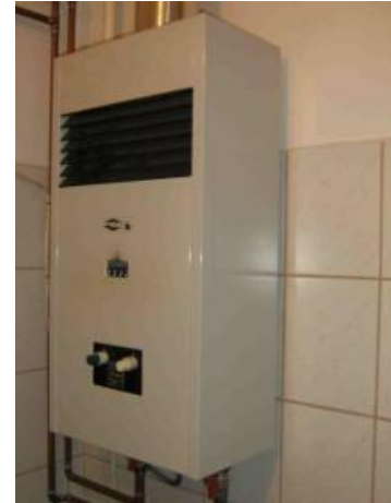
2. ábra "B" típusú gázkészülék

Ebben a kérdésben különösen veszélyes a pontatlan tudás, ami hamis biztonságérzetet teremt! Az utóbbi évtizedben terjedtek el a modernebb, piezo-elektromos gyújtású fűtőkészülékek és vízmelegítők, melyek zárt készülék házzal készülnek , nem látni már sem őrlángot, sem a főégőt. De ettől még nem lesz a gázkészülék zárt égésterű! Alapvetően három gázkészülék-típust különböztetünk meg. Az égéstermék eltávolítását és az égési levegő biztosítását „A” típusú (égési levegő hozzávetetés és égéstermék-elvezetés nélküli) készülékek esetében, (pl. gáztűzhely, gázbojler, hőszugárzó) a helyiség megfelelő szellőztetésével kell(ene) megoldani. A „B” típusú (égési levegő hozzávetetés nélküli de égéstermék-elvezetéssel rendelkező) készülékek, (pl. a legtöbb fűtőkészülék és vízmelegítő, valamint a kéményes konvektorok), az égéshez a helyiség levegőjét használják, a füst a kéményen keresztül távozik. A kéményben viszont csak akkor alakul ki megfelelő áramlás, ha az égéshez felhasznált levegő (távozó füstgáz) helyére friss levegő áramlik a helyiségbe. Mivel a fűtőkészülékek üzeme állandó a légpótlás időszakos szellőztetéssel nehezen biztosítható. Öreg épületek rossz légzárású nyílászárói, egyéb szellőzőkürtők