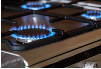
1. ábra "A" típusú gázkészülék

Ebben a kérdésben különösen veszélyes a pontatlan tudás, ami hamis biztonságérzetet teremt! Az utóbbi évtizedben terjedtek el a modernebb, piezo-elektromos gyújtású fűtőkészülékek és vízmelegítők, melyek zárt készülék házzal készülnek , nem látni már sem őrlángot, sem a főégőt. De ettől még nem lesz a gázkészülék zárt égésterű! Alapvetően három gázkészülék-típust különböztetünk meg. Az égéstermék eltávolítását és az égési levegő biztosítását „A” típusú (égési levegő hozzávetetés és égéstermék-elvezetés nélküli) készülékek esetében, (pl. gáztűzhely, gázbojler, hőszugárzó) a helyiség megfelelő szellőztetésével kell(ene) megoldani. A „B” típusú (égési levegő hozzávetetés nélküli de égéstermék-elvezetéssel rendelkező) készülékek, (pl. a legtöbb fűtőkészülék és vízmelegítő, valamint a kéményes konvektorok), az égéshez a helyiség levegőjét használják, a füst a kéményen keresztül távozik. A kéményben viszont csak akkor alakul ki megfelelő áramlás, ha az égéshez felhasznált levegő (távozó füstgáz) helyére friss levegő áramlik a helyiségbe. Mivel a fűtőkészülékek üzeme állandó a légpótlás időszakos szellőztetéssel nehezen biztosítható. Öreg épületek rossz légzárású nyílászárói, egyéb szellőzőkürtők