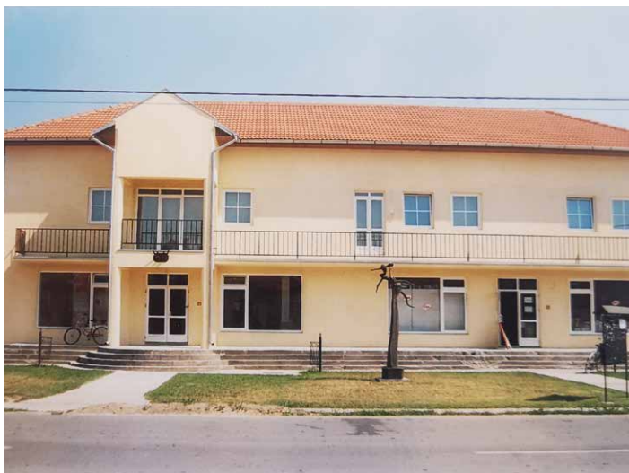
Az újjáépített művelődési ház épülete, Szentlászló, Horvátország