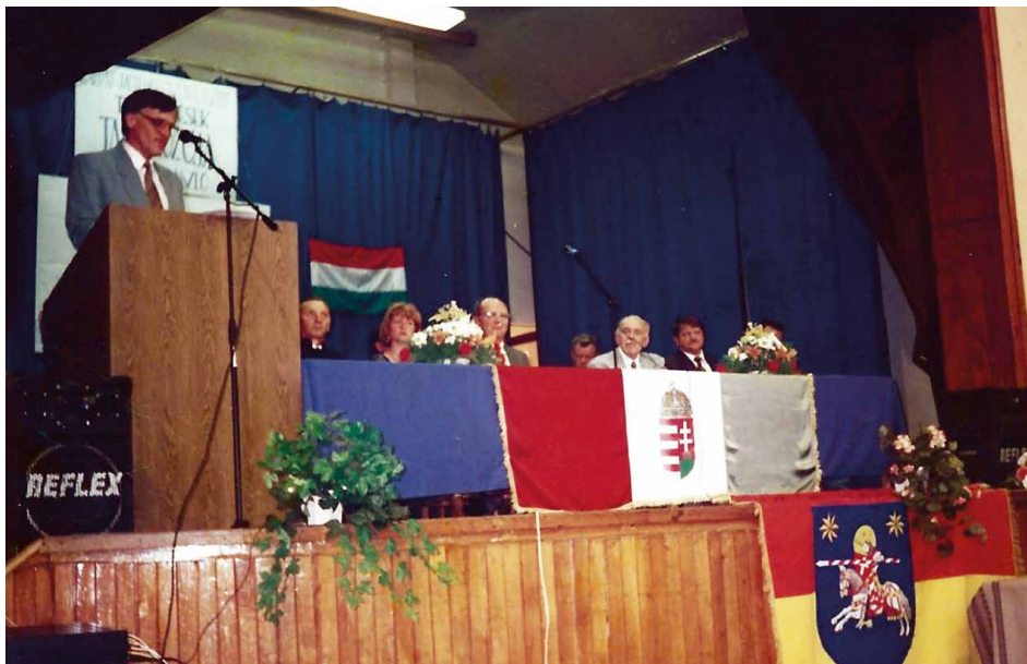
Az első magyarországi találkozó, Vácszentlászló (1996)

Idén 30. alkalommal kerül megrendezésre a Kárpát-medencei Szentlászló Települések Találkozója, melynek most harmadszorra ismét Vácszentlászló ad otthont. A 2026. július 3-5-ig tartandó eseménysorozaton ezúttal tizennégy magyarországi és határon túli Szentlászló nevű település küldöttségét látjuk vendégül. Mint minden nemes cél érdekében kötött szövetség, ez a települések közötti kapocs is mind szorosabbá vált az évek során, és egyre bővült a programhoz csatlakozók száma is. Először 1996-ban, kilenc település részvételével rendezték meg Vácszentlászlón a találkozót, melynek előzményei egészen 1991-ig, a délszláv háború kirobbanásáig nyúlnak vissza.