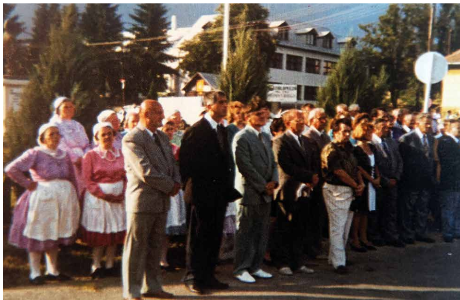
A Kárpát-medencei Szentlászló Települések I. Találkozóján résztvevő küldöttségek (Vácshoz, 1996.)

Közösen vállalt küldetésükről sem feledkeztek meg, 1997 novemberében Vácshoz, Búcsúszentlászló, Mátraszentlászló és Pusztaszentlászló polgármestere Eszékre látogatott a Szentlászló elestének évfordulóján rendezett megemlékezésre, melynek